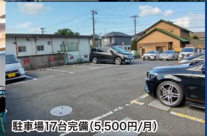
駐車場17台完備(5,500円/月)